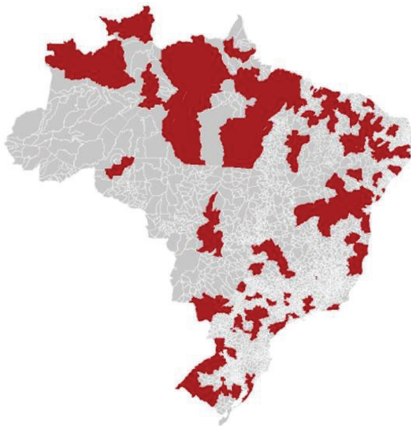
Mapa 1: Distribuição das regiões de saúde pelo território brasileiro (em vermelho)